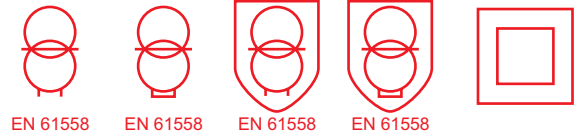
Beispiel / example EI 66/23