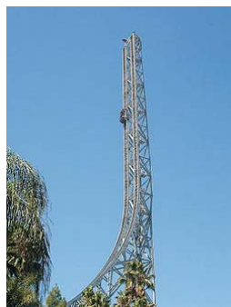
Superman Reverse Free Fall Kalifornien